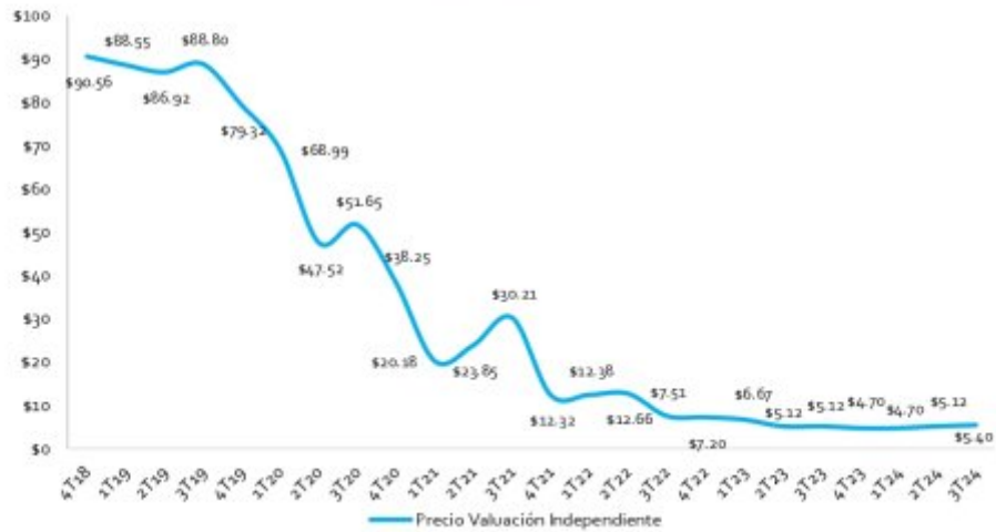
GRÁFICA PRECIO HISTÓRICO

* En el primer trimestre de 2020 se realizó la primera llamada de capital por MXN$124.9 millones con 2,499,996 títulos adicionales dando un total de 4,499,996 títulos en circulación lo cual ocasionó una disminución en el precio por la dilución del título, por otro lado, realizó una distribución por MXN 8.8 millones en diciembre 2019